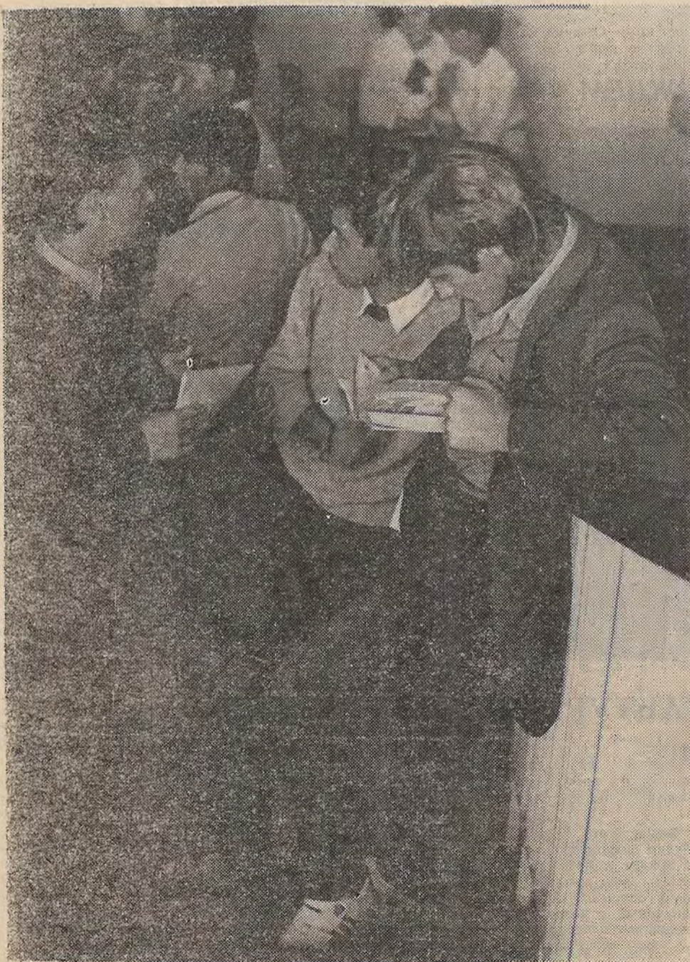
Еще недавно — абитуриенты, а сегодня полноправные члены большой семьи, имя которой — студенчество.